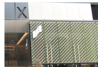
銀座の大型商業施設

国内最大規模のウォータージェット加工機や西日本最大規模の5面加工機を有しており、商業施設の外壁装飾から防水扉等の超大型製品から半導体製造装置のような精密部品の製造が可能。材料は鉄、ステンレスはもちろん、レーザー加工できないアルミ、木材、大理石、ゴム等何でも切断可能。切断時は規格内の寸法の鋼材でも溶接時にたわむ問題を、蓄積された技術・ノウハウ・経験により克服し、顧客からの要求に応え評価されている。