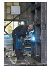
大型製品の溶接作業

社内での技能教育や社外での技術研修と蓄積された経験・ノウハウに基づく高度な技術力を要する多能工と設計・最新鋭の加工・塗装までの一貫加工、生産管理システム等のITを組合せている。顧客であるインフラ、半導体、食品、輸送機の各メーカーの要求する精度や品質に応じている。