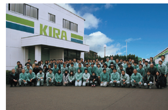
建屋と社員の集合写真

近年では自動車部品メーカーから高性能マシニングセンタの設計、製造、販売を手掛け、加工機単体だけではなく、治具や搬送設備等を統合した「切削加工自動化ライン」の提案を行うことで、多様化した顧客ニーズに対応している。