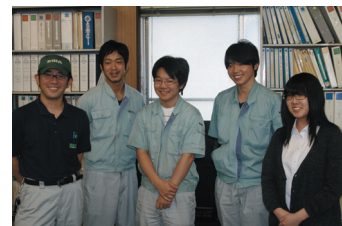
技術部のメンバー。若手社員も活躍中

国内拠点として本社、東京、大阪、鹿児島島の4ヵ所に営業所、研究所を有し、海外にもアメリカ、タイ、インドネシア、中国に拠点を有していることから、活躍フィールドは国内だけにとどまらず世界中にあり、語学力に優れた従業員の採用にも積極的である。また、愛知県西尾市は自動車産業の集積地であり、大手自動車メーカーが売上の95%を占めていること及び常に変化する市場ニーズに即応するため「ものづくり」に携わる技術者の採用に積極的であり、幅広い人財活用・人材育成を行っている。