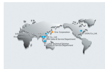
アメリカ、タイ、中国の子会社

アメリカ、タイ、中国に設立した現地法人により、自動化ラインを止めない定期点検、機械の故障に対する迅速な対応が可能なサービス拠点を設置している。また新興国であるインドネシア、ベトナム、タイではボール盤の製造、販売の受注が見込めるため、製造販売会社の設立を予定している。新興国では顧客密着型の現地窓口を持ち、現地ユーザーの技術レベルを十分に把握した上で技術ギャップに配慮した提案を行い、丁寧なフォローと十分なアフターフォローを徹底している。