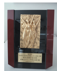
日本でいちばん大切にしたい会社大賞表彰盾

2014年度に社員1人あたりの時間外労働は、月間6時間未満と極端に少ない。夜勤なし、有給取得率80%以上など人を大切にする経営を貫き、社員の士気も高く、業績も業界平均を上回り創業以来連続黒字経営を続けていることなどが評価され受賞した。社員の幸せ実現経営をビジョンに掲げ、80%で満足し働く喜びや自己成長を感じられる腹八分経営を目指し、会社は小さくても輝きながら働く楽しみ方改革を進め、多くの会社見学も受け入れている。