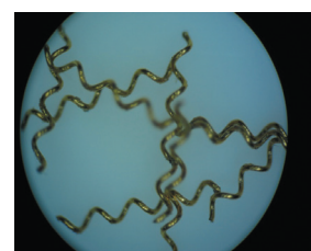
アルツハイマー研究向け動物実験用コイル

同社は線径0.05ミリから12ミリのばねを社内生産しているが、微細コイル加工が得意で、10年前に医大との出会いで開発した動物実験用脳血管コイルはアルツハイマーの研究に世界の医療機関で現在も使用されている。ばねを長く巻く長尺加工が得意で、極細線を細く長く巻く技術を生かし医療部品用の各種コイルを生産している。特に開発中の多層多層巻コイルは今後特殊コイルとして世界へ販売を予定している。