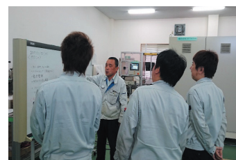
従業員との打ち合わせ

2001 年に現社長と設計者 3 名で創業。その後、現社長のリーダーシップにより受注や人材の獲得、先進的な装置の製造に奮闘を重ねて業容を拡大。今は、30 名程度の従業員の雇用や地域企業への外注などにより地域経済の活性化に貢献。社長のモットーは、「常識にとらわれずリスクに挑戦」、「失敗を恐れず変化に即座に対応」、「少数精鋭」。世の中の変化が激しく、これらのことを常に意識していないと、ついていけなくなってしまうためである。