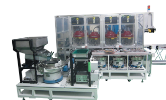
自動基盤マウンタ装置

人の手に頼っていた検査工程を完全自動化するなど顧客の工場内の効率化を推進。例えば、エアコン製造のための特殊な金属部品の検査装置を開発・製造。それまでは、作業員が行っていた「ノギスで高さを測定、ルーペで傷を確認、機械操作で荷重チェック」をまとめて完全自動化。終業時に仕掛けておけば、翌朝には 4,500 個程度（7.5 個 / 1 分 × 60 分 × 10 時間）の部品の検査が完了。まさに、高度な機能を有する産業ロボットを開発・製造。