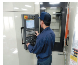
技能研修で加工技術の維持・向上

新入社員には図面の見方、設計担当には3D-CAD、管理者には管理職研修など、階層別に細かく設定した教育プログラムを実施し、キャリア形成を図っている。技能者については、旋盤、マシニングセンタなどの技能研修を実施し、全員に国家技能検定2級以上を取得させている。これにより、高精度な加工技術の維持・高度化を推進している。高校、産業技術専門学院、大学など多様な人材を確保している。県外からUIJターンの大学・大学院卒業生、女性等の技術者も採用している。