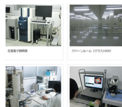
新設したテクノセンタの設備

超精密機器の設計・開発・製造拠点として、2014年7月に「テクノセンタ」を建設し操業開始。これらの超精密機器製品は、半導体開発に必要な評価機器として、我が国のイノベーションを支えている。