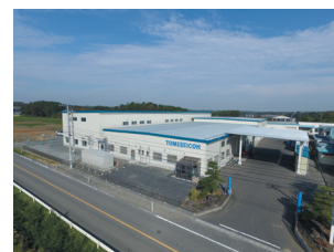
自動車部品専用工場

大手自動車グループの有力部品企業であるプレス会社の協力を得るとともに、2014年には自動車部品専用の新工場を建設して高効率な機械の導入や、材料加工から溶接、表面処理までの一貫生産ラインを構築し、自動車産業へ参入。大手自動車メーカーへバッテリー関連の部品等を供給している。また、地域企業の自動車部品参入を後押し、地域経済に貢献し、新規参入「コネクターハブ企業」として部品の一部について、地域企業4社を開拓し、協力工場として活用し、技術支援も行っている。