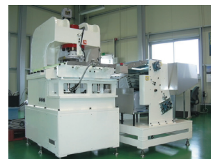
同社製品：カシメ機

航空機分野では、宮城県内の中小製造業5社と共に共同受注体「エアーズみやぎ」を結成。各社の得意分野を生かし、部品の加工から表面処理、最終検査に至るまで一貫して請け負える体制を構築している。