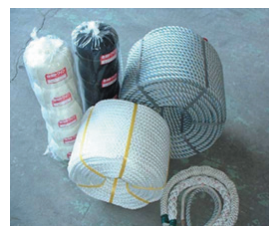
新型製綱機を導入し総合メーカーへ

現在、ドイツ製の最新式製綱機の導入を進めている。スーパー繊維の製造のみならず国内でも品薄となっているハツ打ちロープ製の製造も可能となり、防音処理も行われている。騒音も少なく人員もかからないこの機械を深夜を問わず稼働させることにより、飛躍的な生産量のアップを目指している。先述のスーパー繊維ロープについては価格的に割高であるため小分け販売用の製造販売にも取り組み、この工夫により少しずつであるが販売量がアップしている。