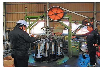
最新設備の見学の受入れ

当時、事業後継者であった現代表の提案で設備の近代化（日本で初めての海外製の最新のロープ製造機の導入）を同業異業者を問わず公開する取組を行う。通常は極秘事項であろう同社の製造設備の見学の受入れは、同業異業者を問わず色々な人脈の構築に成功した。技術・ノウハウの伝承や従業員教育方法、営業手法なども長年の積み重ねにより習得し、昨年法人化の際に代表取締役就任することにより、円滑な事業継承を行うことができた。