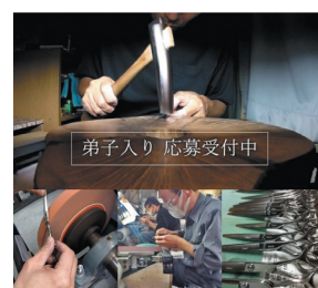
弟子入り募集の広告求人

社員の平均年齢は45歳。ベテラン熟練工員の技術を後世に伝承するため、若者の採用に積極的に取り組む。「ものづくりに興味のある若者」をターゲットに、市内の工業高校・高専、ジョブカフェ、求人サイト、SNS等を駆使した結果、同社にとっては初めての女性社員を今後採用予定。これまでは男性中心の職場であったが、女性職人が活躍するものづくり企業のロールモデルとして職場環境の整備等々に力を入れている。