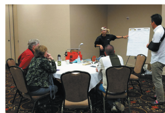
米国での講演の様子

2017年11月に米国で開かれたハサミ業界のコンベンションでは日本メーカーで唯一の招待を受け、「日本の理美容ハサミの製造技術の高さ」の講演、修理技術を米国人へ指導する等、日本の鋏職人の技と心を世界発信している。現在は市場調査を踏まえ、米国に向けた情報発信や商品開発も推進中。