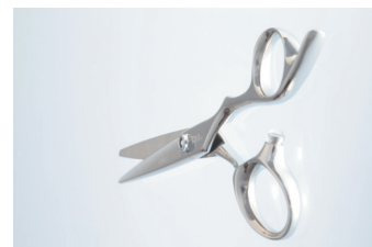
理美容ハサミ「コバルトシリーズ」

創業以来60年以上、理美容師が快適に使っていただけるハサミを設計・製造しているものづくり企業。1973年に同社が開発し、2015年にグッドデザイン賞を受賞した自社ブランド「コバルトシリーズ」は、世界で始めてコバルト基合金を使用したハサミであり、鉄をほとんど含まないため、さびることがなく、切れ味が長続きする。「ものづくり・品質」を一番に考えながら、米国への海外展開、将来を見据えた人手不足対応等、未来に羽ばたく取組を展開している。