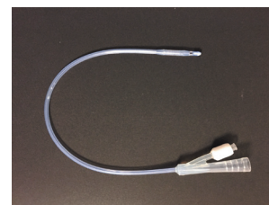
シリコンチューブ事業に参入

若手が中心となって、会社をおもしろくするには如何にするべきかを念頭にプロジェクトチームを発足しスタートした。製造の改善の表彰に加えて、今年から技能オリンピック（はんだ付け）を開催し、従業員のモチベーション向上や技術力向上を図っている。