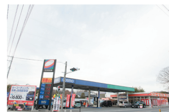
サービスステーション

同社は「地域密着」をモットーに、ガソリンスタンドや燃料配送、LPガスなどの燃料事業を主軸とした会社である。2012年にリフォーム事業を立ち上げ、2017年には福島県白河市にリフォームショールームを2店舗目としてオープンさせた。ガスショップから始まったリフォーム店として「スピード対応を丁寧に行うこと」、「細かく小さなお悩みに真剣に向き合うこと」を意識し事業展開している。