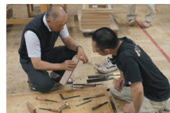
社長自らが従業員に技術を教える風景

従業員に家具製作技能士の資格取得を促進。昇給制度を充実させ、休日の工場を開放した自主訓練の場を設けることにより、社員の技能が向上し、取得率は90%を超える。また、技能を習得した従業員が独立しやすい社風を醸成することにより、1979年の創業以降、約40名が独立。全国各地で活躍する職人とのネットワークを活用し、各地の消費者ニーズ等を情報収集するとともに、大型受注を分担するなど、同社の重要な経営資源となっている。さらに、女性の採用も積極的に行っており、従業員42名のうち10名を女性が占め、デザインや繊細な家具作りに貢献。