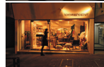
IFDAの様子(上)と都内専門店の外観(下)