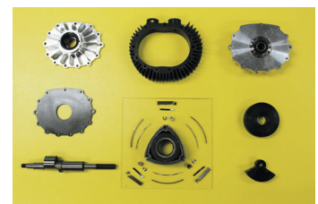
ロータリーエンジンの主要部品 (NR-20 α P)