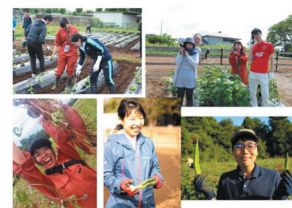
若手農業従事者の育成

グループでの農業参入10年以上の経験を活かし、いままでのいわゆる「きたない、くらい、かっこ悪い」の3K農業から、新3K「キレイ、気持ちいい、かっこいい」農業を目指し、女性が就農できる環境作り、新しい農業の担い手作りを進めている。この結果、「安心・安全・高品質さつまいも原料の安定供給」や「若手農業従事者の育成」を実現する他、「なめがたファーマーズヴィレッジ」では地元で150名を採用するなど、地元の雇用創出にも貢献している。