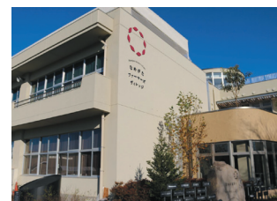
なめがたファーマーズヴィレッジ (小学校廃校跡地利用)

グループ全体の取組として、茨城県行方市に「さつまいも」をテーマとした観光農業体験施設「なめがたファーマーズヴィレッジ」を2015年10月にオープン。同施設は、廃校となった小学校と耕作放棄地を利用して整備し、JA・農家・同社が計3億円を出資して設立した農業生産法人（株）なめがたしろはたファームが運営している。同施設のメインとなる工場棟では、地場の茨城県産サツマイモを中心に加工品を製造するなど、地域資源を活用している。