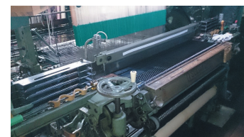
中幅シャトル織機

1998年頃、現社長が、同社の西陣織の技術を活かして、軽く強く耐久性等にも優れる炭素繊維の製品化を決意。折れや擦れに弱い炭素繊維を、織機を改良して、織ることに成功。あわせて、毛羽立ちやすい炭素繊維の生地に特殊な樹脂加工を施す技術も開発。炭素繊維と他の繊維を組み合わせることも考案して、炭素繊維で意匠性のある織物を織れる世界で唯一の企業となる。同社の技術は、日本の大企業や欧州ブランドからも高く評価されている。