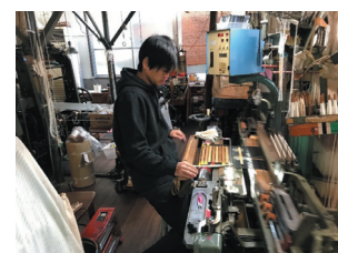
伝統工芸の帯を織る若手従業員

社内には、西陣の産地でトップクラスの、皇族への献上品を製作した職人もおり、伝統的な西陣織の高度な技術も、炭素繊維を織る特殊技術も、同社内で円滑に技術継承されている。昨今、伝統工芸に関心を持つ若者が増えており、同社の評判を聞いた若者から常に入社希望がある。西陣織の産地では、技術を要するため、新規雇用の場合も経験者を募集するが、同社は未経験の若者を積極的に雇用しており、現在の同社従業員の約半分は20代。