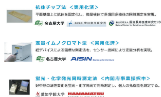
大手企業との共同開発検査システム

大豆の健康効果の個人差に着目した『ソイチェック』や腸内環境をみる『腸活チェック』など、身近な食生活に関する検査を実現。30代～50代の女性を中心に累計ユーザー数は15万人を超え、全国の医療機関650施設、調剤薬局約2,000店舗で展開。大手通販サイトでは『ソイチェック』が検査キット部門で1位を常時獲得。健保組合や自治体でも健康意識向上等のため活用が進んでいる。