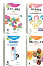
郵送検査サービス「カラダチェック」の各商品

同社は検査サービスを通じて、医療機関で保有しない未病段階の顧客情報や生活習慣に関するデータを取得。顧客からデータの二次利用の同意を得て、研究用途、情報提供へ活用している。検査結果と生活習慣や行動特性を解析し、各ユーザーに生活習慣改善提案サービスを進めている。