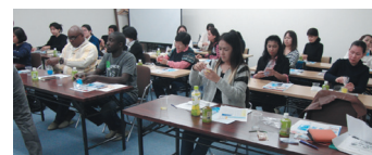
海外研修生との国際交流会

2017年度、今後の海外展開を見据え、2人のベトナム人を正社員（大学の新卒）として採用。日本人社員にとっても、外国人を現場で教育することが、視野を広げ、自分の仕事を俯瞰できる機会となっている。また、商品によっては手作業の加工も多いため、短時間労働を希望する子育て世代の女性を積極採用。男女の格差はなく、7名の管理職の内、女性を3名起用している。多様な人材の活用が同社の挑戦を支えている。