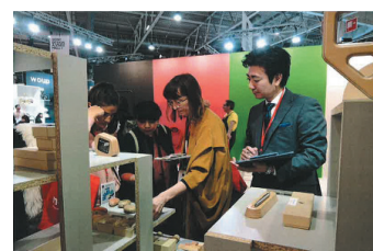
海外展示会への積極的な出展

日本の合板は、海外との価格競争等により販売数が激減しているが、品質や精度の面では世界をリードしている。創業 80 年超の同社は、日本の技術力の高さを世界にアピールしたいという思いから、品質を維持しつつデザイン性も兼ね備えた、自分達にしかできないオンリーワン製品として「ペーパーウッド」を開発。海外展開にあたっては、著名美術館のミュージアムショップを当面のメインターゲットとし、製品の認知度や信用力を高めることで、今後幅広い販路開拓を図る戦略をとっている。