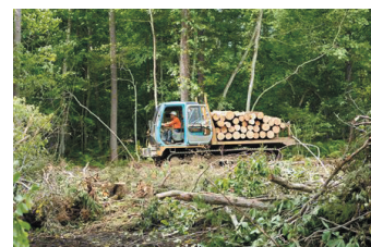
地域広葉樹資源活用へのこだわり

同社のオリジナル合板である「ペーパーウッド」に用いられているのは、シナの木とシラカバの間伐材であり、北海道の恵まれた広葉樹資源を活用している。地元森林資源を活用することにより、林業活性化のみならず、森林のメンテナンスに繋がり、森林の保水力を維持するなど、地元の森林環境保全にも貢献している。また、クラフト製品の製造は、地元家具メーカー、クラフト工芸メーカーと連携するなど、地域の木材加工産業全体の活性化、高付加価値化に寄与している。