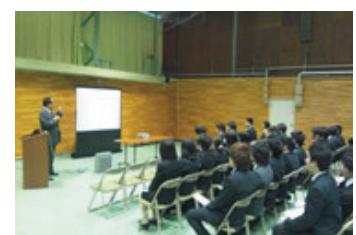
企業説明会の様子

地元の工業高等専門学校と協力し、地域連携事業の推進を図り地域社会の発展に寄与することを目的とした函館高専地域連携協力会を設立。同社代表が同会会長を務め、高専全学生が出席する地元企業の説明会を毎年開催し、同社のみならず、地元企業の新卒採用に大きく貢献。また、同高専では、同社の寄付による「メデック基金」を設立し、新たに入学者の育英基金制度を創設し、地元の多様な技能人材の輩出に貢献している。