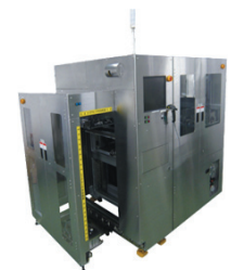
国内最速のIC挿抜装置

半導体製造の温度・電圧試験工程において、自動化・高速化を他社にさきがけいち早く確立。数千のICをテストボード、試験装置へ自動かつ高速で挿入・抜き取りするハイスペック装置を1995年に開発し、現在ではICの正確な位置を認識するための画像処理技術等の改良により、1時間当たりの処理数では他社の2割増となる国内最速を実現。さらに多品種に手軽に対応するための交換キットを安価で提供するなど国内外の半導体・電子機器メーカーのニーズにきめ細やかに対応し国内では80%のシェアを獲得。