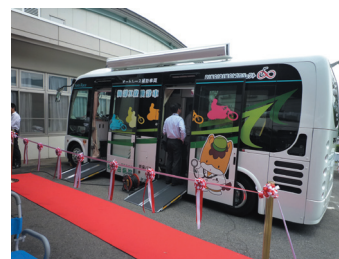
小型超低床レントゲン車

タイヤサービスカーのノウハウを活せる新規事業として電気自動車の電欠対応の需要可能性を検討していたが、電気自動車以外の用途にて、特殊用途自動車（地震体験車、検査測定車、オイル輸送車、電気自動車を輸送するキャリアカー等）の事業可能性が見えた。そこで、更に車両開発と事業企画を進め、当初のタイヤサービスカーのコア技術を活かしつつ、各顧客のカスタム仕様に応じた各種特種用途自動車（Q電丸シリーズ）の新規事業を開始した。