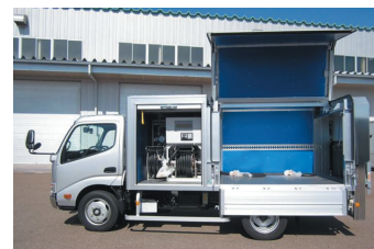
特殊用途自動車の例

タイヤサービスカー開発に際し、搭載する整備機器を稼働させる発電システム「Trure-Gシステム」（走行用エンジンに直結した小型小容量の発電機を用いて走行しながら発電するシステム）を自主開発した。また、エンジン停止中に給電できるような蓄電装置（バッテリー）を装備できるシステムである。これによって、大きく重い発動発電機を搭載しなくてもよく、荷台を他の作業や用途に活用できるようにしている。本仕組みによる車両は、特許も取得している。