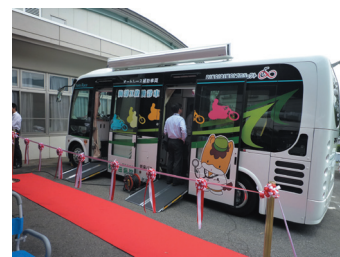
小型超低床レントゲン車

タイヤサービスカーのノウハウを活せる新規事業として電気自動車の電欠対応の需要可能性を検討していたが、電気自動車以外の用途にて、特殊用途自動車（地震体験車、検査測定車、オイル輸送車、電気自動車を輸送するキャリアカー等）の事業可能性が見えた。そこで、更に車両開発と事業企画を進め、当初のタイヤサービスカーのコア技術を活かしつつ、各顧客のカスタム仕様に応じた各種特種用途自動車（Q電丸シリーズ）の新規事業を開始した。