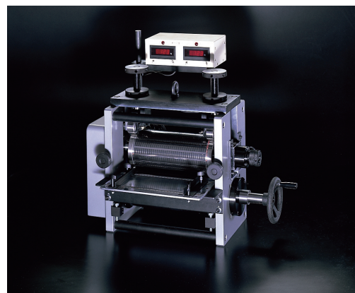
ロータリー打ち抜き装置

高品質・短納期へのニーズに対応するため、新たな刃物、刃型、新たな生産システムを開発し、フィルム基板や液晶関連などのIT分野へも事業展開を図っている。