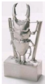
オオクワガタ 2004年金賞

現在では、ハイエンドの3次元CAD/CAM 5台・高速M/C5台・M/C2台・高速ワイヤー放電加工機1台と会社規模に比べて多くの設備を有し、「こんなものどうして加工する」という問いかけに3次元加工の経験の深さというノウハウで解決。複雑形状製品も、自社開発による治具を製作し同時5軸制御のマシニングセンターにて切削が可能である。大手精密機械メーカー主催の切削加工コンテストにおいて4回の受賞を誇る。