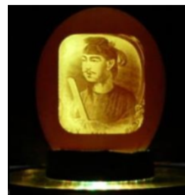
卵の殻アート 2008年金賞