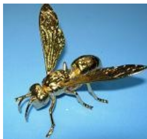
スズメバチ 2005年金賞