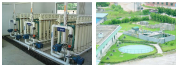
中国深圳市排水リサイクル膜装置

クリプトスポリジウム(感染すると水溶性下痢・腹痛等を惹起する)に代表される原虫類や細菌類を完全除去する設備の完全自動化を実現し、維持管理が容易、装置のユニット化、コンパクトで省スペース化により工事期間を大幅に短縮できる等から、小規模能力(10~200トン/日)海水淡水化装置を開発。離島・船舶搭載等に商品化し、緊急用(トラック運搬可)に貸出しも行っている。