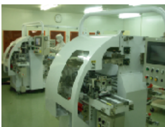
スリット加工装置

PET・ポリイミドなどのフィルム系材料、銅・アルミ・ニッケル・チタン・アモルファス合金などの非鉄金属、及びそれら素材の複合材料まで（粘着製品含む）材質を問わず高精度スリット加工が可能。