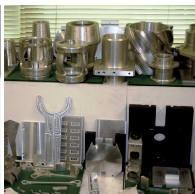
各種分野機械部品サンプル