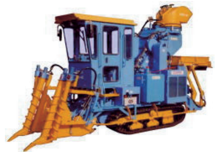
小型ハーベスター