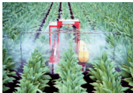
たばこ畑での防除作業の様子