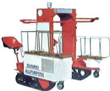
たばこ管理作業車

平成16年(2004)には、タイの企業とさとうきびハーベスターについて技術提携を実施。